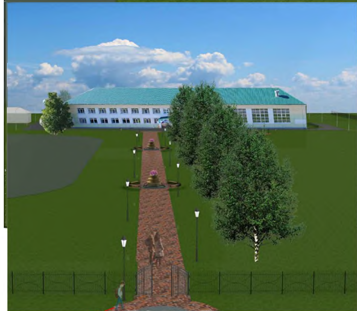
Входная группа с ул. Индустриальная